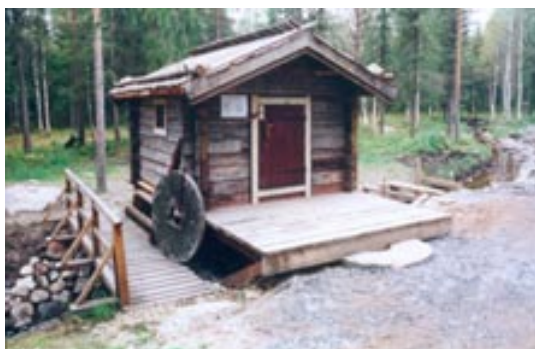
skvaltkvarn vid Alviks fåbodar.

www.albuf.nu/foreningar/hbf/hbf-start.htm