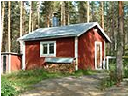
bagarstugan i Långnäs